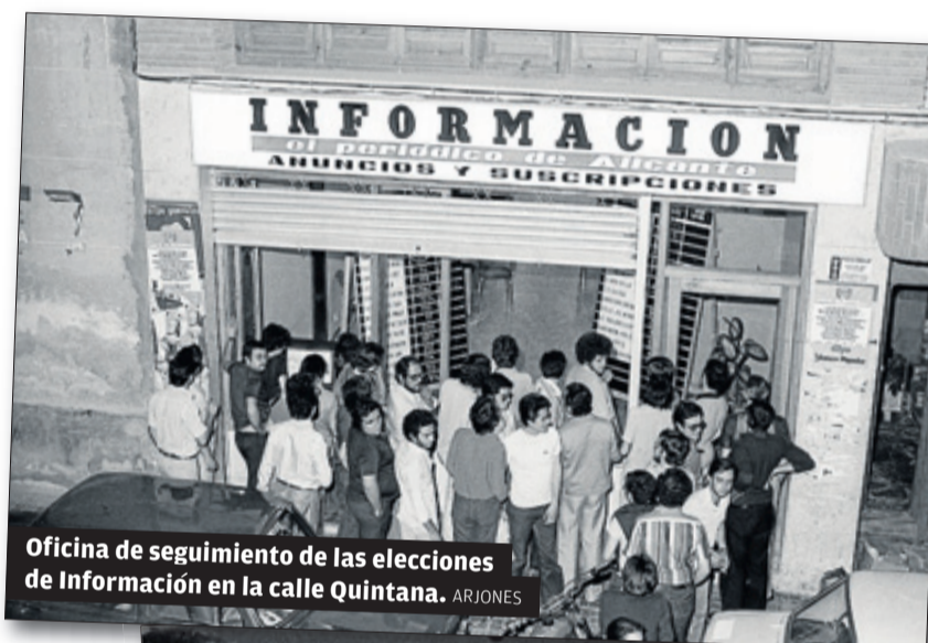
Oficina de seguimiento de las elecciones de Información en la calle Quintana.

La semana que viene seguiremos recordando aquel jubilo- so día de hace 39 años, con sus resultados y valoraciones.