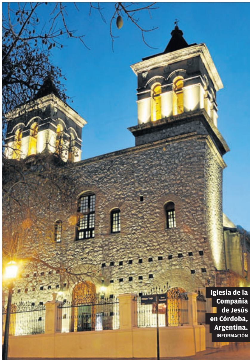
Iglesia de la Compañía de Jesús en Córdoba, Argentina. INFORMACIÓN